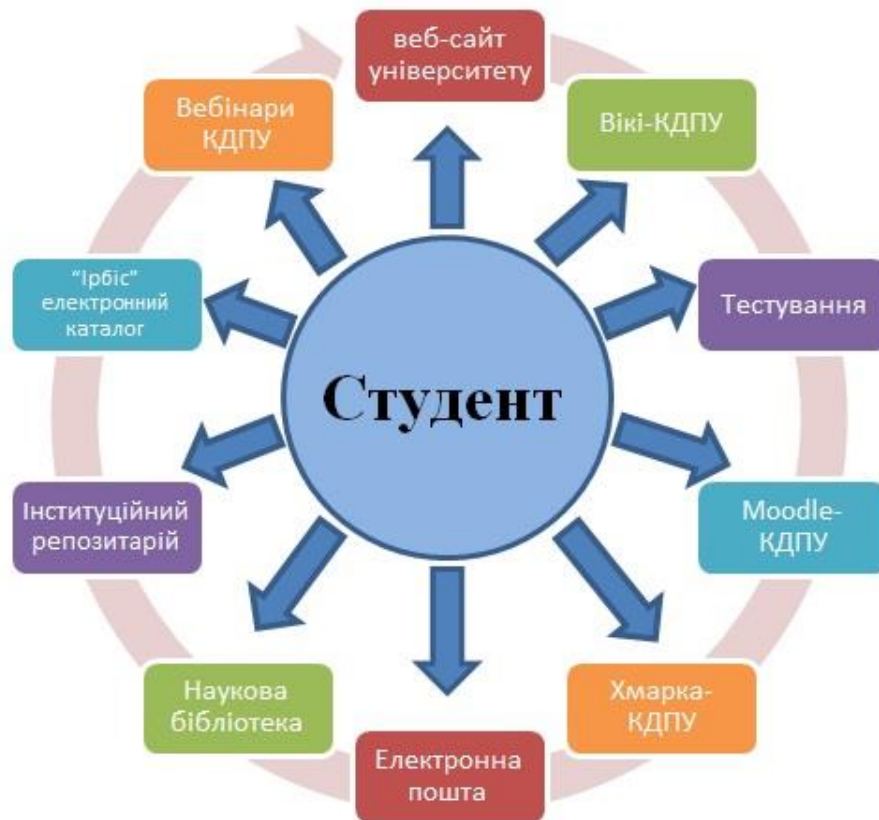
Рисунок 3. Схема інформаційного освітнього простору студента КДПУ

Висновки. Як видно з рисунка 3 у центрі інформаційного освітнього простору КДПУ знаходиться студент. Ця схема (рис. 3) демонструє, що розбудова інформаційної інфраструктури університету здійснюється відповідно до освітніх потреб учасників навчального процесу. Тому використання ресурсів ІОП дозволяє покращити якість навчання у КДПУ, а саме: понизити роль географічного розташування студентів; розширити обсяг освітніх послуг використовуючи інструменти дистанційного та змішаного навчання; через потужний інтернет-канал посилити інтенсивність потоків освітніх повідомлень.