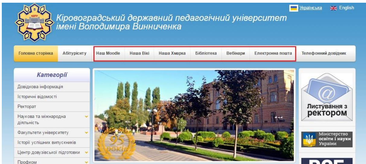
Рисунок 1. Веб-сайт КДПУ

Сукупність усіх перелічених вище веб-ресурсів утворює інформаційний освітній простір університету. Веб-сайт КДПУ виконує агрегуючу функцію по відношенню до інших сервісів, а саме, до будь-якого сервісу можна потрапити за посиланням (рис. 1) на верхній горизонтальній панелі.