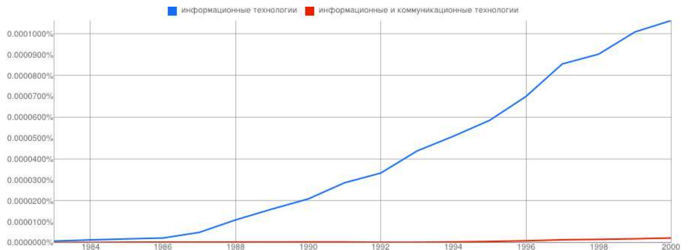
Рис. 1 Вживання термінів «інформаційні технології» та «інформаційні та комунікаційні технології» у російськомовних джерелах

В свою чергу, поняття «інформаційні та комунікаційні технології» вперше зустрічається в журналі «Проблемы теории и практики управления» в №1-6 за 1995 рік [25].