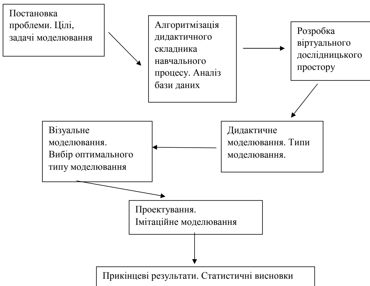
Рис. 2. Схема цілісного процесу дидактичного моделювання.

Проілюструємо на схемі цілісний процес моделювання від постановки проблеми до прикінцевого результату на рис. 2.