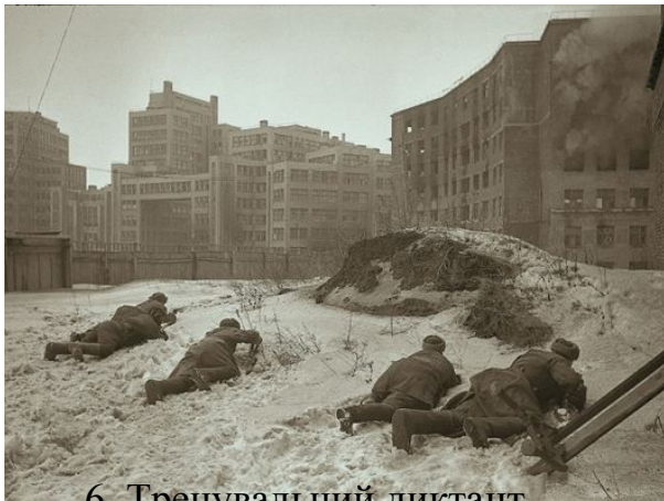
6. Тренувальний диктант