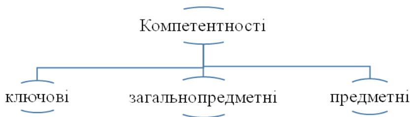
Рис. 1. Структура системи компетентностей в освіті

На думку С. А. Ракова, компетенція – еталон досвіду дій, знань, умінь, навичок, творчості, емоційно-ціннісної діяльності, який встановлює суспільство [6]. В ОКХ бакалаврів з комп'ютерної інженерії зазначається, що компетенція включає знання й розуміння, знання як діяти, знання як бути [5]. На рис. 1 показана структура системи компетентностей в освіті.