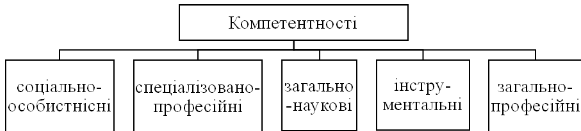
Рис. 2. Основні компетентності бакалаврів з комп'ютерної інженерії

Основні напрями професійної діяльності бакалаврів з комп'ютерної інженерії – організаційна, проектувальна, технологічна, дослідницька. Виробничі функції, якими повинні володіти бакалаври з комп'ютерної інженерії: дослідницька; організаційна; проектувальна, технологічна.