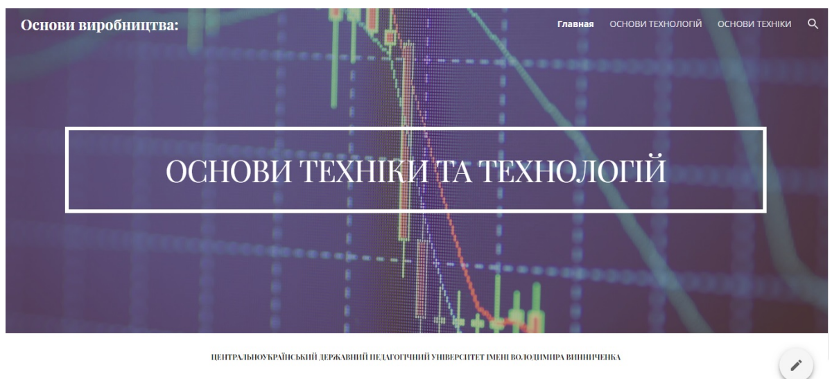
Рис. 2. Скриншот сторінки створеного сайту в Google Sites «Основи техніки та технологій»

Зважаючи на високу популярність серед українських користувачів та широкі можливості Google , пропонуємо скористатися даним сервісом при організації навчального процесу ЗВО. На базі доступних програмних продуктів Google можна створити конкретні електронні навчальні курси. Наприклад, нами було розроблено навчальний сайт Google Sites New (рис. 2) та створено вільний