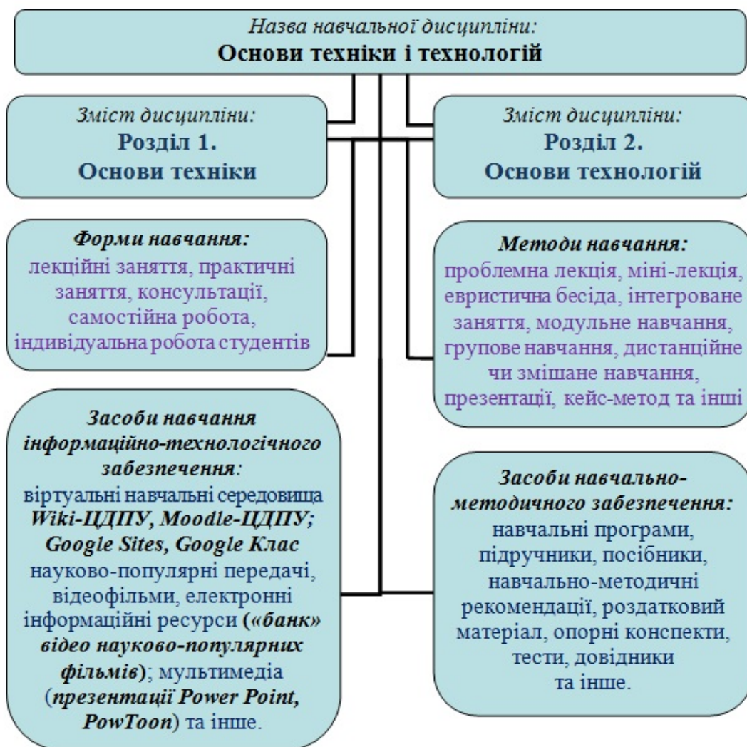
Рис. 1. Дидактичний інформаційно-технологічний комплекс до навчально-методичного забезпечення вивчення курсу «Основи техніки та технологій»

засобів інформаційної підтримки; смарткейси; електронні інтерактивні освітні ресурси; навчальні середовища для самостійного конструювання електронних навчальних ресурсів; навчально-технологічні програмні засоби; імітаційні середовища; системи автоматизованого проектування; навчально-ігрові програмні засоби; педагогічні програмні засоби навчальних дисциплін; демонстраційні електронні ресурси; автоматизовану систему оцінки і контролю знань студентів [2; 4; 5].