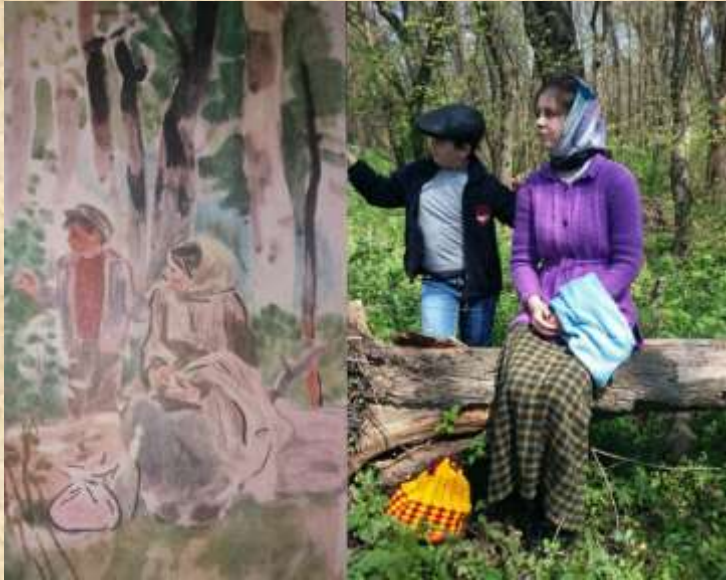
Сухомлинський В. О. «По волосинці»

Автор ілюстрації: В. А. Євдокименко