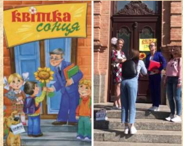
Сухомлинський В. О. «Квітка Сонця»

Автор ілюстрації: В. А. Євдокименко