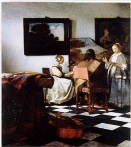
Ян Вермеєр. Концерт.