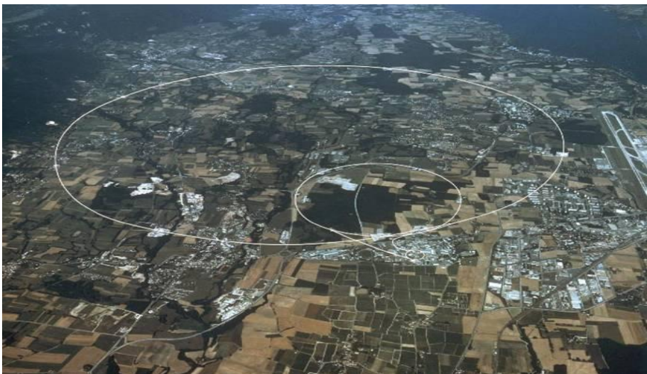
ЦЕРН - загальна схема. Річний бюджет установки складає 1 мільярд євро. Цю суму спонсорують 20 країн-учасниць проекту.

Колись про речі на кшталт походження світу, чи ключових законів буття могли розмірковувати лише філософи та поети. Ці часи давно відійшли у небуття. Сучасні вчені у лабораторіях всього світу досліджують швидкість перебігу часу; обчислюють імовірну кількість паралельних світів; описують процеси, котрі відбувались у перші хвилини виникнення Всесвіту та займаються тисячами інших речей, які трохи більше століття назад могли сприйматись лише як химерні метафори або чудернацькі мовні звороти.