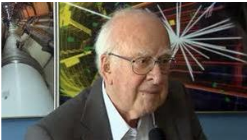
Пітер Хіггс, британський фізик, котрий у 1964 році передбачив існування бозона Хіггса.

вересні 2008 року. Результат цього будівництва, швидше за все, відомий під назвою Великого адронного колайдера (ВАК).